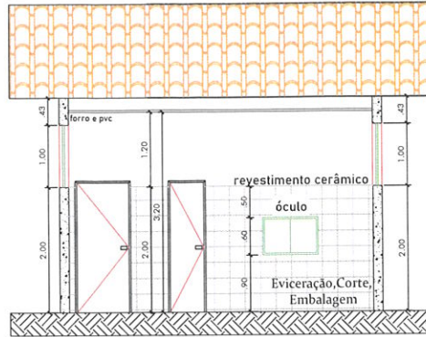
Corte AA ESCALA 1:75